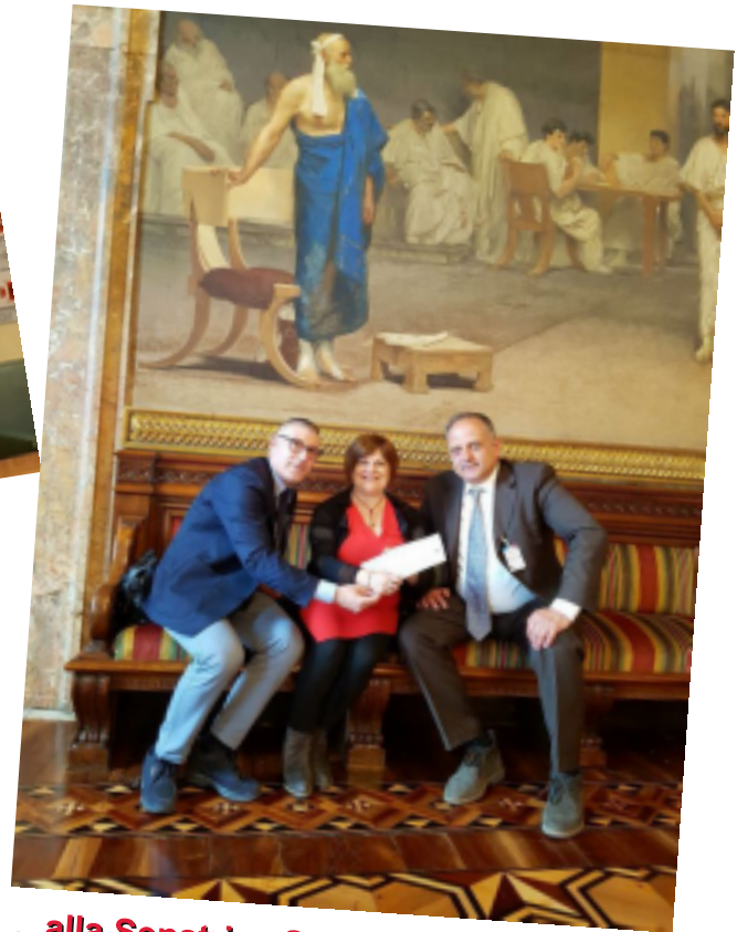
...alla Senatrice Stefania Pezzopane