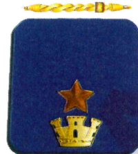
Commissario Capo nuova nomina