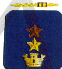
Vice Questore Aggiunto nuova nomina