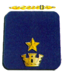
Vice Questore Aggiunto