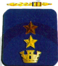
Vice Questore Aggiunto non ancora promosso al 2023