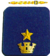
Commissario Capo già in servizio