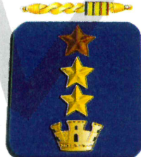
Vice Questore già V.Q.A. alla data del decreto