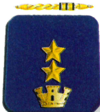
Vice Questore Aggiunto già in servizio