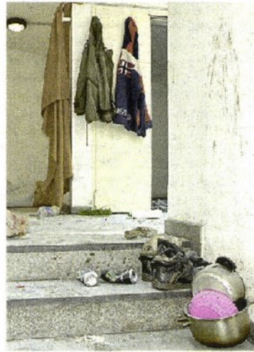
IL PARCHEGGIO Il piano trasformato in rifugio di fortuna