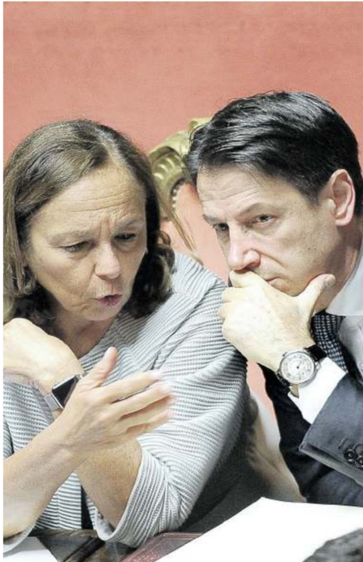
Il presidente del Consiglio Giuseppe Conte con il ministro dell'Interno Luciana Lamorgese